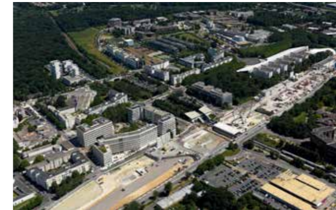
ZAC du pôle gare (Noisy - Champs) par la SPLA-IN Noisy-Est Requalification de l'offre commerciale de la dalle du Champy.

Sur le territoire d'intervention d'EpaMarne-EpaFrance, la dynamique démographique se maintient et progresse même fortement sur certaines polarités. Cette croissance se traduit par de nouveaux pôles urbains où l'on trouve une offre forte de logements, emplois, commerces et services de proximité. Les fonctions sont mixées et permettent de réduire les distances domicile/travail. Les activités économiques privilégiées sont celles qui offrent une diversité d'emplois, notamment dans les quartiers proches des gares.