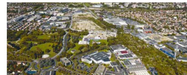
ZAC Champigny Paris-Est en montage (Champigny-sur-Marne) Création d'une offre de locaux d'activités vitrine de l'économie productive (75 % des emprises foncières dédiées aux activités économiques).