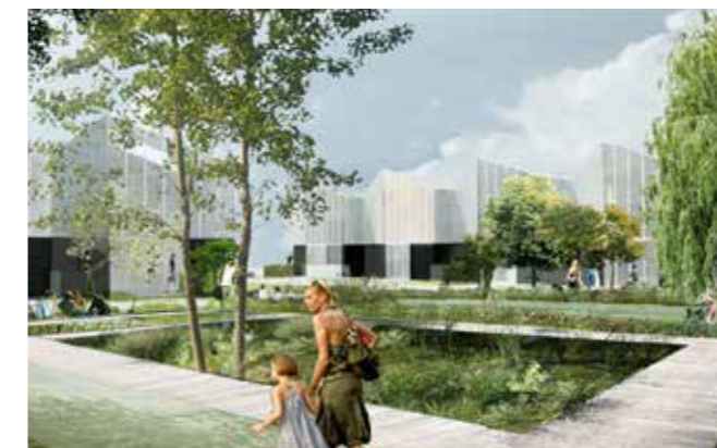
ZAC de la Charbonnière (Montévrain) Avant-projet Soho : locaux d'activités et habitations.

L'accès à la propriété sera facilité dans les opérations d'aménagement et le bail réel solidaire sera expérimenté. EpaMarne-EpaFrance veillent à maintenir des prix de logement accessibles, à la location et à la vente, pour tous les budgets. Le prochain enjeu consistera à produire des logements évolutifs, c'est-à-dire qui se transforment en fonction des parcours de vie. Les résidences intergénérationnelles sont l'une des réponses proposées.