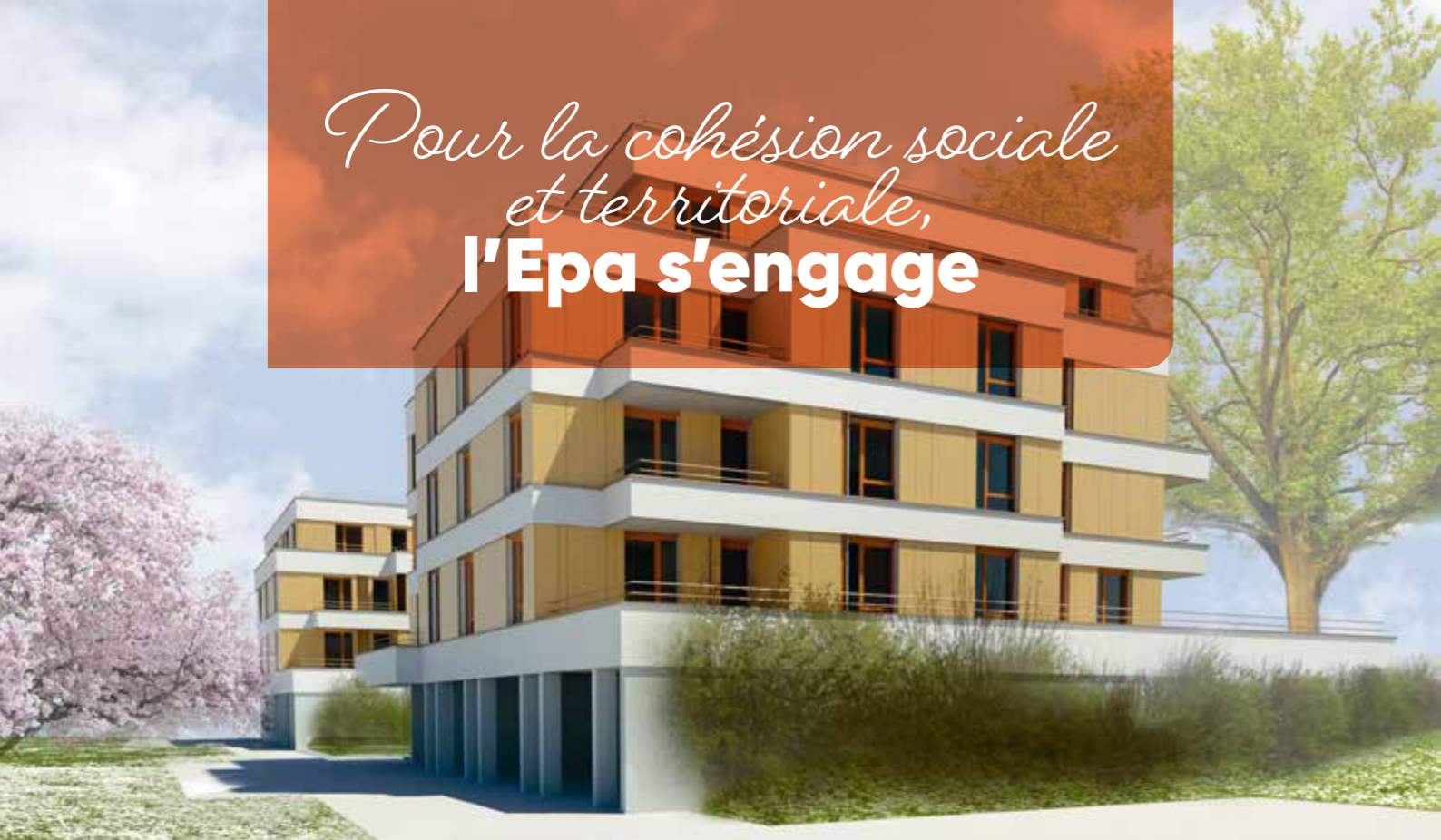
ZAC des Coteaux de la Marne (Torcy), construction d'une résidence intergénérationnelle et intégration systématique de logements sociaux dans chaque programme