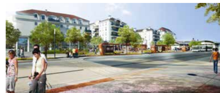
Pôle gare (Bussy Saint-Georges) Interventions artistiques de l'artiste Carlos Medina dans le cadre du réaménagement de la gare.

La stratégie d'aménagement anticipe et prépare ces évolutions.