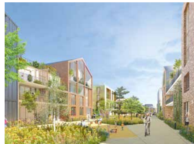
ZAC Plaine des Cantoux (Ormesson-sur-Marne) Introduction d'un objectif de 50 % de logements sociaux.

L'attractivité du territoire est un objectif prioritaire d'EpaMarne-EpaFrance. Les opérations contribuent à structurer des filières (économiques, agricoles...), à rapprocher compétences et emplois, à développer des projets touristiques et artistiques au service de la notoriété du territoire.